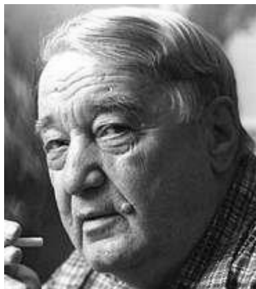
Гумилев Лев Николаевич (1912–1992), докт. геогр. н., докт. ист. н.

В эти годы на кафедре работает Лев Николаевич Гумилев, известный историк, географ и этнолог.